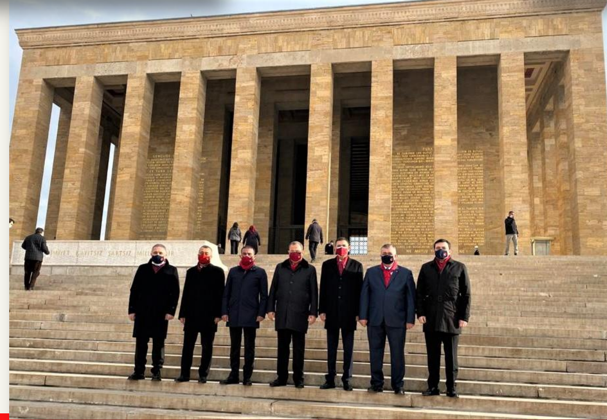
8 Şubat 1921 Antep'e 'GAZİ' unvanı verilisinin 100. yılı